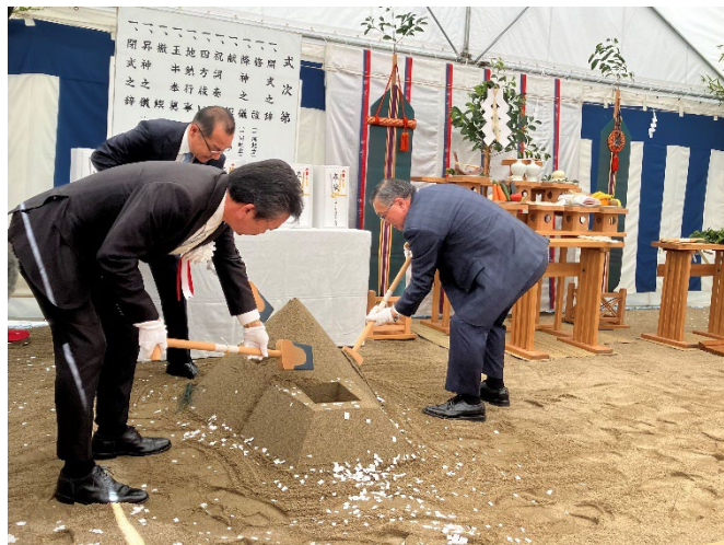
起工式の様子（鋤3名 写真左手よりレポインターナショナル、コスモ石油、日揮 HD の代表）