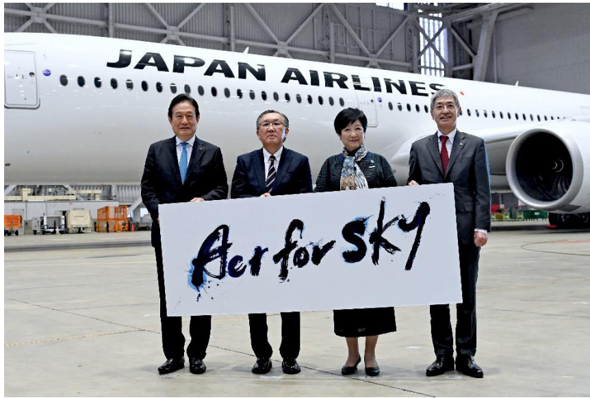
行政初、東京都が ACT FOR SKY に加盟