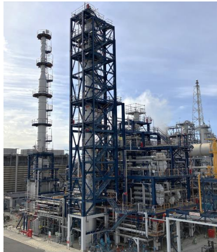
SAF 製造設備（2024年12月撮影）

※1 NEDO ウェブサイト https://www.nedo.go.jp/koubo/FF3_100312.html