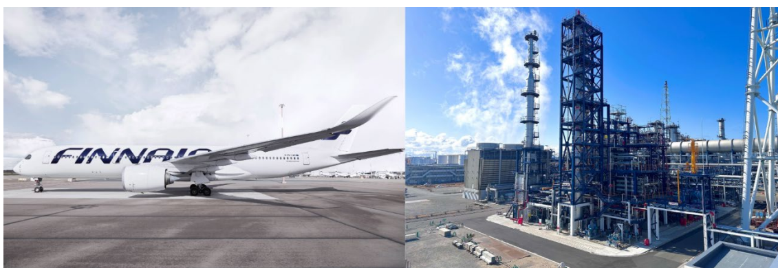
フィンエアーの機体と SAF 製造装置（コスモ石油堺製油所構内）