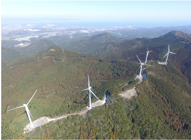
(大分ウィンドファーム)