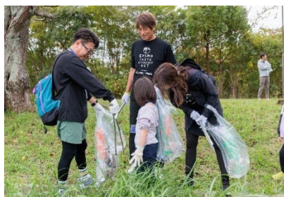
清掃活動の様子（千葉県市原市）