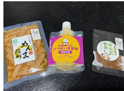
「株式会社 樹」の食品