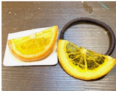
「アトリエまりこあめ」のアクセサリー