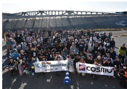
参加者の集合写真（静岡県掛川市）