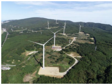
新岩屋ウインドパーク