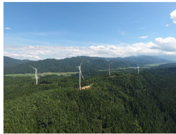
鶴ヶ峰風力発電所