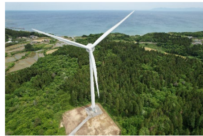
風の杜おが風力発電所