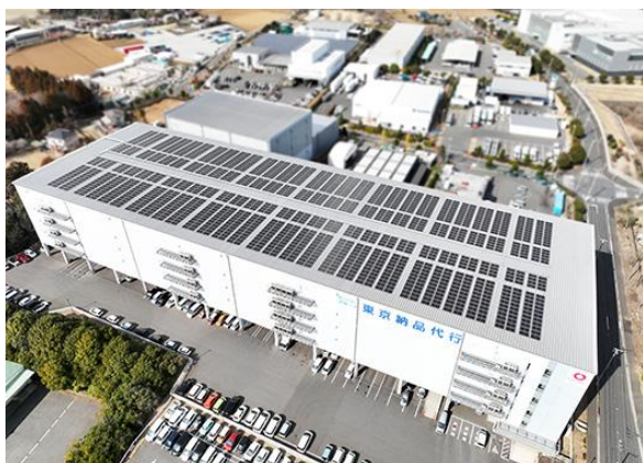
【東京納品代行 成田 FLC I 外観】