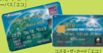
コスモ・ザ・カード「エコ」

コスモ・ザ・カード・オーパス「エコ」、コスモ・ザ・カード「エコ」は、「地球のために何かしたい」という思いを実現するための、どなたでも参加できるカードです。