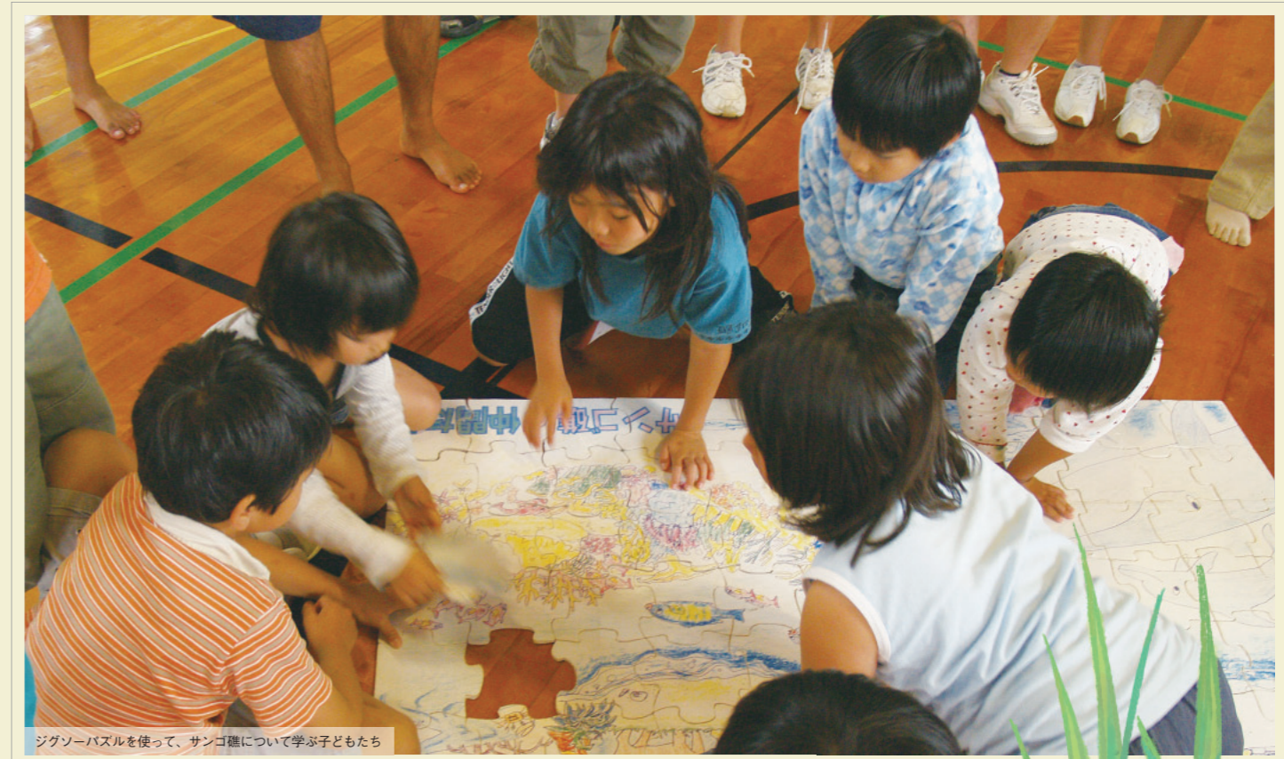
ジグソーパズルを使って、サンゴ礁について学ぶ子どもたち

3. 再発防止策 システムの改修は既に実施しておりますが、今後のシステム開発運用の管理体制を見直します。 併せて、エコカード基金の収支報告書に掲載される金額については、エコカード基金事務局だけでなく、販売部門でも確認するダブルチェック体制にすることで、管理体制を強化し、今後の業務改善・再発防止に努めてまいります。