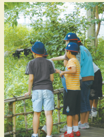
ビオトープ見学の様子

の学校へと、環境問題に対する意識が広がっています。 また、学校教育の場などで活用して頂くための環境学習サイト「EE kids」を構築し、環境教育のプラットフォームづくりも行なっています。 これらのプログラムにより、子供たちが環境問題に目を向けるきっかけとなり、身近にとらえられるようになること、また学校教育の中に環境教育が根付くことをめざして、支援していきます。 なお昨年度までの実績としては、2003年度から日本国内の学校に対して支援を開始し、2008年度までに延べ42校、約2,000人の児童や生徒、約100名の教員に対してプログラムを実施してきました。