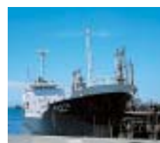
大型化する内航タンカー

今後も、きめ細かな計画で配船のミスマッチを減らすとともに、日石三菱(株)との提携を活かし、受け入れ基地の共同化などの方法で、船型の大型化をさらに進めていきます。また、減船、休日・夜間荷役の推進などにより、稼働率アップを図り、さらなる燃料消費の削減を目指します。