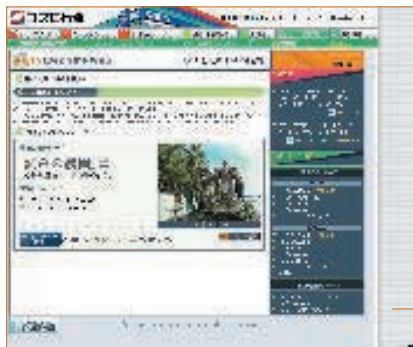
ホームページ 「TVCM on the Web」

WEB ▶ http://www.cosmo-oil.co.jp/tvcm/index.html