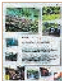
「森はなくせない」篇

中日新聞広告賞は読者による一次審査と専門家による二次審査によって選ばれる広告賞で、「暮らしに役立つ情報がえられる」「話題性・社会性がある」といった審査基準のほかに、表現上の完成度や情報の量・質といった点について考慮され「炎は消えた」篇は「優秀賞」を受賞しました。