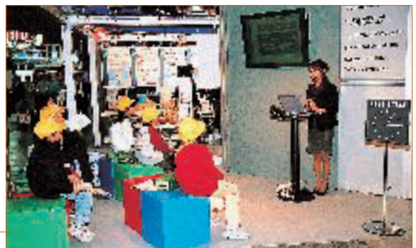
エコクイズの実演中の様子

コスモ石油とグループ会社5社の環境保全活動や環境ビジネスを紹介し、エコクイズやブースツアーを通して、子どもたちとともに環境とエネルギーについて考えました。また、気軽に参加できる環境貢献を目指して、コスモ石油エコカード基金の環境貢献活動サイトで生産された米や工芸品(フェアトレード商品)、二酸化炭素吸収証書(p41参照)の背景をご説明しながら販売しました。収益は基金の活動に役立てています。エコプロダクツ展への出展は3年目になります。