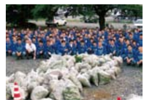
四日市製油所の三滝川清掃

コスモ石油グループでは、製油所・工場・研究所やオフィス等の周辺での清掃活動を行っています。2008年6月、四日市製油所では、製油所および関係会社から約160名が参加して三滝川の清掃を行いました。坂出製油所では、製油所の近隣企業各社とともに道路清掃を実施しました。各地域との調和と共生を図るため、今後も活動を継続していきます。