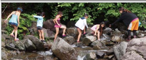
コスモわくわく探検隊 交通遺児の小学生を対象とした自然体験プログラム。車社会の一翼を担うコスモ石油の社会貢献活動として、1993年より毎年1回開催。