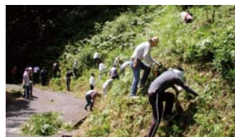
「コスモの森」里山保全活動

しています。またグループ会社のコスモ松山石油(株)でも、愛媛県の推進する県民参加の森林づくり活動に賛同する形で、2007年4月より「コスモの森」活動に取り組んできました。2011年度も6月と10月の2回、コスモ松山石油の社員とOBが参加して里山の保全活動に努めました。