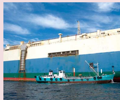
大型船舶への洋上補油(手前が給油船)