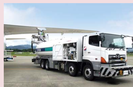
航空機の主翼への給油

コスモ石油の産業燃料部は、工場用のボイラー燃料や発電用燃料をはじめ、航空機、船舶、トラック、バス向けといった輸送用燃料等の供給を担っています。このように産業燃料部のお客様が使用される燃料油の用途は多種多様であり、また、お客様の機器の要求性状により、品質面で個別にご要望をいただくケースもあります。産業燃料部はお客様ごとに異なるさまざまなニーズでできる限りお応えし、安定的かつ高品質な燃料油の供給を通じて、日本の暮らしを支え、産業の発展に貢献していきたいと考えています。