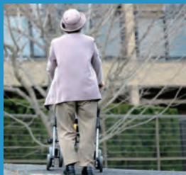
高齢化社会 労働人口の減少