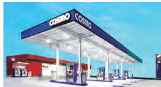
石油製品の精製と販売 個人向けカーリース