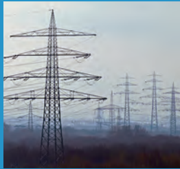
低いエネルギー自給率