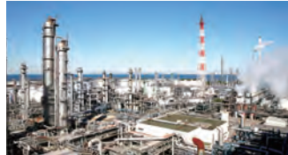
石油化学製品の製造・販売