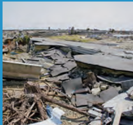
多発する自然災害