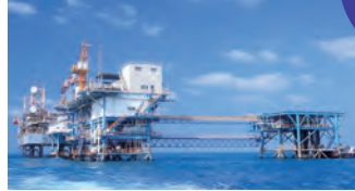
原油の開発および調達／製油所へ輸送